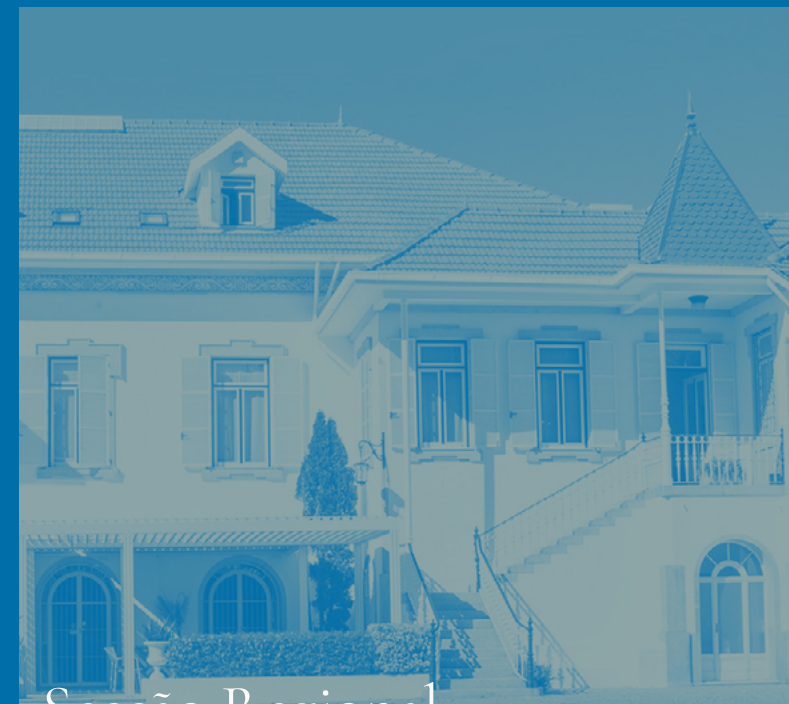
Secção Regional do Norte da Ordem Dos Médicos